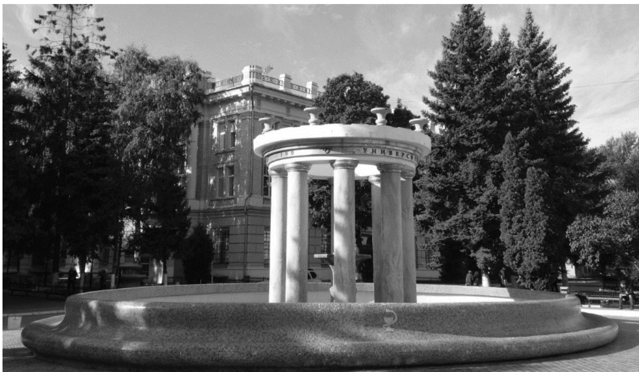
Фонтан на территории академического городка - ул. Большая Казачья, 112